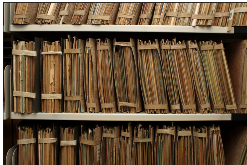
Abb. 3: Aufbewahrung der Schulprogramme vor dem Boxing 2009

Wie in den meisten Bibliotheken war der Bestand an Schulprogrammen der ULB Düsseldorf vor Beginn des 2009 gestarteten Projekts weitgehend unerschlossen. Lediglich etwa 1.000 wissenschaftliche Abhandlungen waren im PI-Katalog nachgewiesen. In die hbz-Verbunddatenbank wurden davon durch Retrokonversion etwa 600 Titel aufgenommen. Der Bestand war im geschlossenen Magazin aufgestellt, allerdings nach unterschiedlichen Kriterien geordnet: Bis zum Erscheinungsjahr 1877 waren die Hefte nach dem Alphabet der Orte aufgestellt und die Schulprogramme aus den Jahren 1878–1888 nach Erscheinungsjahren geordnet und innerhalb der Jahre nach Orten sortiert. Die Publikationen aus dem Zeitraum 1886–1916 hingegen waren nach den sogenannten Klussmann-Nummern 4 aufgestellt. Zusätzlich gab es eine vierte alphabetische Sortierung speziell für die Orte des Rheinlands und des Bergischen Landes. Vermutlich handelt es sich hierbei um den von der Landes- und Stadtbibliothek Düsseldorf gesammelten Bestand.