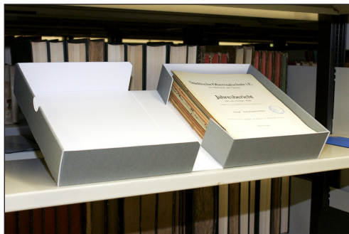
Abb. 5: Aufbewahrung der Schulprogramme nach dem Boxing

Von dem feinsortierten Bestand wurde eine Bestandsliste angefertigt. Dieses Vorgehen bietet mehrere Vorteile: Die Liste ermöglicht einen Abgleich des Bestands mit dem anderer Einrichtungen, damit kann eine gezielte Kooperation mit anderen Bibliotheken eingeleitet werden und sie wird für die weitergehende Digitalisierung eingesetzt.