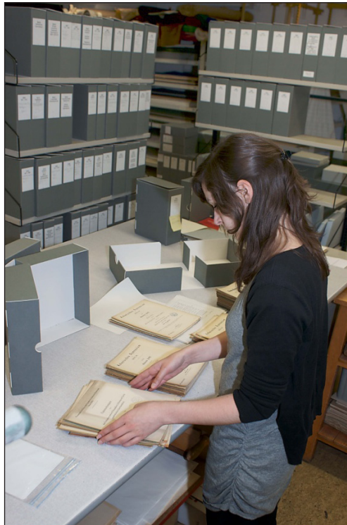
Abb. 6: Sortieren der Schulprogramme in der Restaurierungswerkstatt der ULB

Insgesamt gesehen ist diese durchaus aufwändige, aber notwendige Sortierung also eine grundlegende Voraussetzung für eine effektive und effiziente Erschließung und Digitalisierung. Zugleich ermöglicht sie, diesen Prozess z.B. unter landesbibliothekarischen Gesichtspunkten zu steuern: Wir haben mit der Aufbereitung der Schulprogramme des Regierungsbezirks Düsseldorf begonnen, werden mit denen des Rheinlands und Westfalens fortfahren und im nächsten Schritt, in Abhängigkeit von den Katalogisierungsprioritäten anderer Bibliotheken, sukzessive den Gesamtbestand erschließen. Wir hoffen, dass sich im Laufe des Projekts die Zahl der Fremddaten durch Katalogisierungsaktivitäten anderer Bibliotheken vermehren und dies die lokale Arbeit beschleunigen wird.