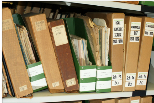
Abb. 4: Alte Umverpackungen der Schulprogramme