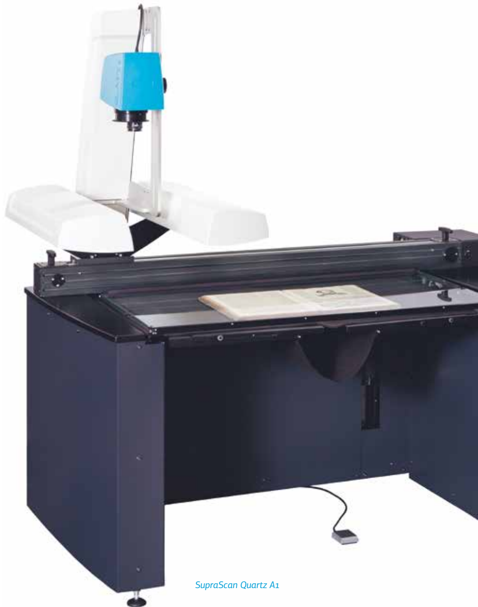
SupraScan Quartz A1

Darüberhinaus akzentuiert das einzigartige Beleuchtungskonzept Strukturen und Texturen und ermöglicht die reflexionsfreie